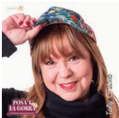
Colaboradora de ponte la gorra por los niños con cáncer

Me demostraste que la educación es primordial en el desarrollo integral de un niño y en situaciones delicadas de salud, tiene su función terapéutica, consiguiendo que los niños sigan siendo niños por encima de cualquier enfermedad. Gracias para darme la oportunidad de aprender a tu lado; una experiencia totalmente enriquecedora, realmente fue como ir a una escuela de aprendizaje de la vida. Desde entonces, he potenciado las más habilidades de boy scout, de observación y sobre todo de saber estar en cada momento y saber leer, interpretar y valorar todo el lenguaje no verbal que expresa un niño.